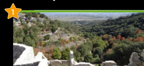
Santa Catalina Lorategi Botanikoa Jardín Botánico de Santa Catalina