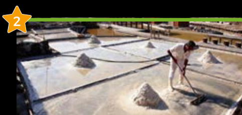
Gesaltza Añana Salinas de Añana