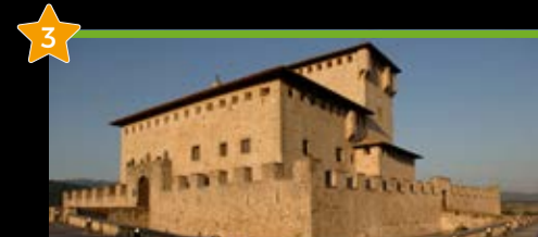
Baronatarren dorretxea Torre-Palacio de los Varona