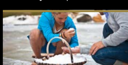
Gatzaren dastaketa Cata de sal

🍷 Nahitaez probatu behar duzu No debes de probar