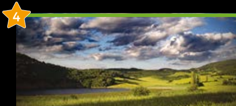
Kaizedo Behekoko lakua Lago de Caicedo-Yuso

🍷 Nahitaez probatu behar duzu No debes de probar