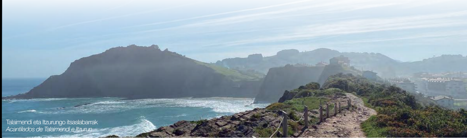
Talaimendi eta Itzurungo itsaslabbarrak. Acantilados de Talaimendi e Itzurun.

km 0 --- ZUMAIA. San Telmo kaleari jarraituz, Itzurungo itsaslabbarren atzealdetik igoko gara, eta izen bereko basiliza ikusiko dugu haien gainean. Hari buruzko lehen aipamen idatzia 1540. urtekoa da. Santu titularra marinelen zaindaria denez, XVII. mendetik aurrera San Telmo Itsas Gizonen Kofradiaren egoitza izan zen basiliza hori. Haren ondoan, asfaltoa atzean utzi eta bidexka estuan barrena egingo dugu aurrera, geruzen norabideari jarraiki, eta Algorri begiratokira iritsiko gara.