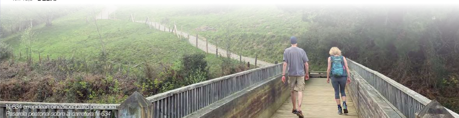
N-634 errepidean oinezkoentzako pasabidea Pasarela peatonal sobre la carretera N-634