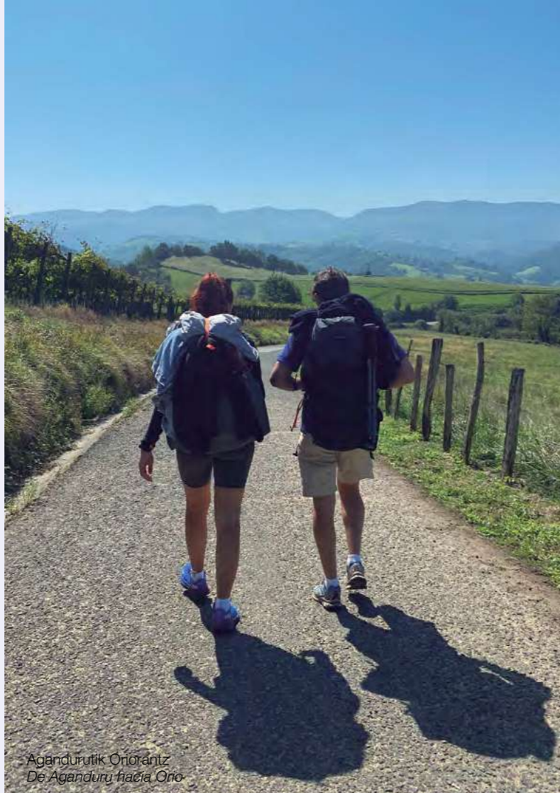
Agandurutik Oriorantz De Aganduru hacia Orio

La parte vieja de Orio, data del siglo XIII. Sus calles empinadas y escalonadas, de trazado casi laberintico, conservan blasones, piedra arenisca labrada, balcones de colores y empedrados que le dan un marcado aire medieval.