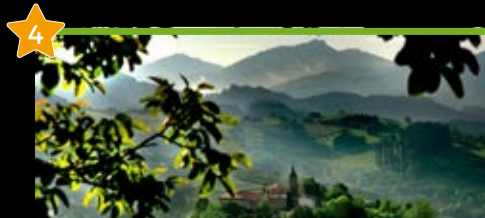
Garai, Durangaldeko begiratokia Garai, Mirador de Durangaldea

Nahitaez probatu behar duzu No debes de probar