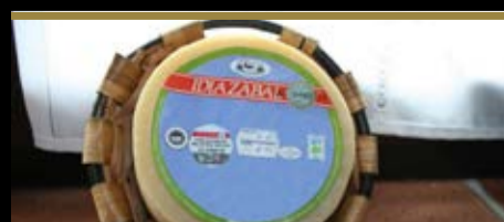
Idiazabal gazta Queso Idiazabal

Informazio puntuak Puntos de información