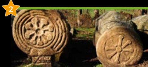
Argiñetako nekropolia. Elorrio Necrópolis de Argiñeta. Elorrio