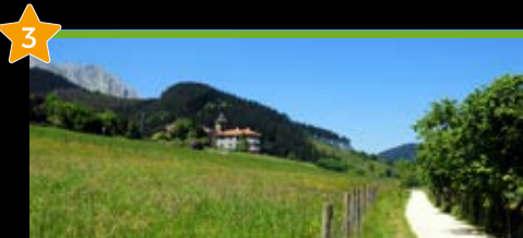
Arrazolako Bide Berdea Vía Verde de Arrazola