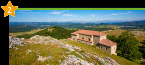
2 Oroko Santutegia Santuario de Oro