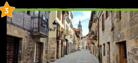
3 Otxandioko erdigune historikoa Casco histórico de Otxandio