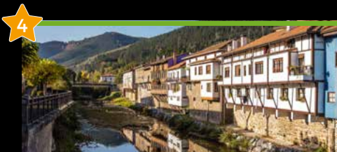
4 Ibilbide interaktiboa Orozkoko erdialdean barrena Ruta interactiva por el casco de Orozko