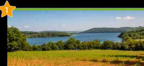
1 Urtegiak Embalses