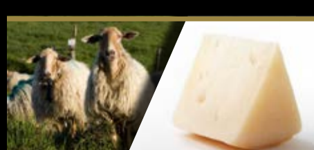
Karrantzako gazta Queso carranzano