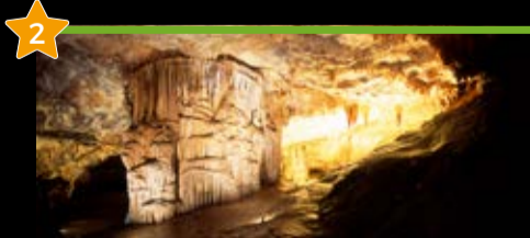
Pozalaguako kobazuloa Cueva de Pozalagua