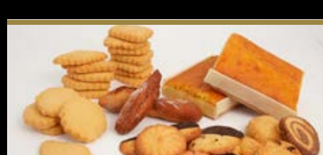
Matxako etxeko pastak Pastas de Matxako