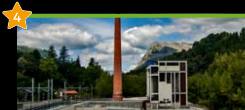
Dolomitas Museoa Museo Dolomitas