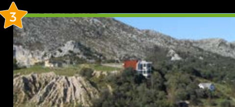
Parketxe Centro de Interpretación del Parque