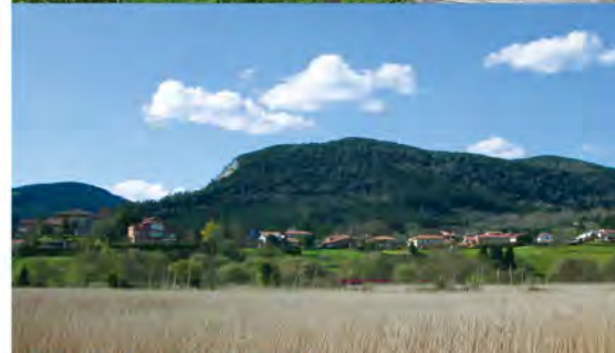
Vistas de Forua desde la ría