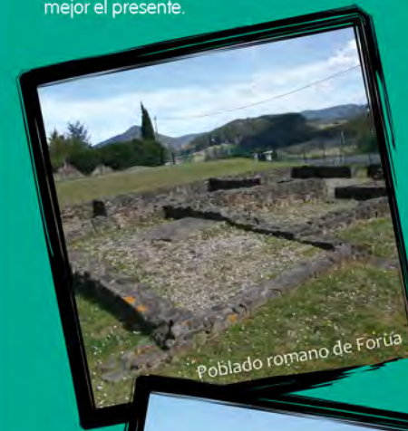
Poblado romano de Forua

La villa de Gernika, la anteiglesia de Lumo, el castro de Kosnoaga, la torre Urdaibai, la cueva de Atxeta y el poblado romano de Forua son algunos de los elementos principales de la historia de esta comarca. Este recorrido pasa junto a todos ellos y nos permite viajar al pasado, para comprender mejor el presente.