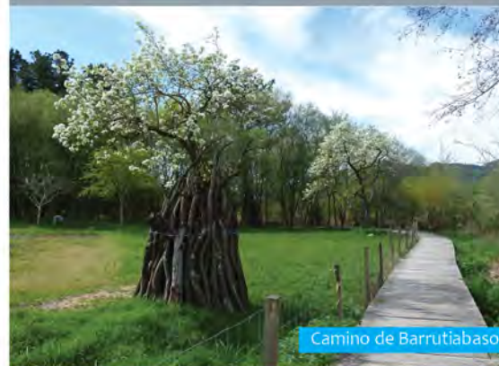
Camino de Barrutiabaso

Patronato de la Reserva de la Biosfera de Urdaibai. Torre Madariaga 94 403 23 60